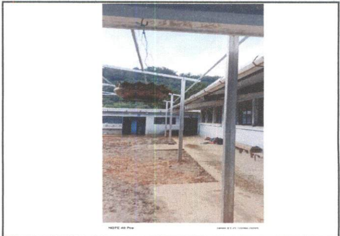
Foto 2: Mejoramiento e Instalacion Tipo Portico con Lamina Troquelada Calibre 26